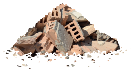
Mélange de déchets issus de la démolition

Avec swissporECORIT, il est possible pour la première fois de combiner une circularité maximale avec une empreinte carbone minimale, tout en conservant les mêmes caractéristiques techniques. Lors du traitement des déchets de construction / de démolition dans le centre de traitement des déchets de construction des entreprises Eberhard (EbiMIK), les matières secondaires sont produites et leur qualité est comparable à celle des matières premières primaires. C'est à partir de ces matières secondaires que l'isolant swissporECORIT est fabriqué.